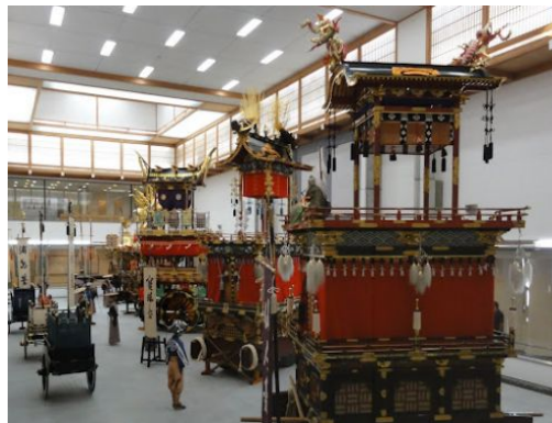
Takayama. Yatai Kaikan