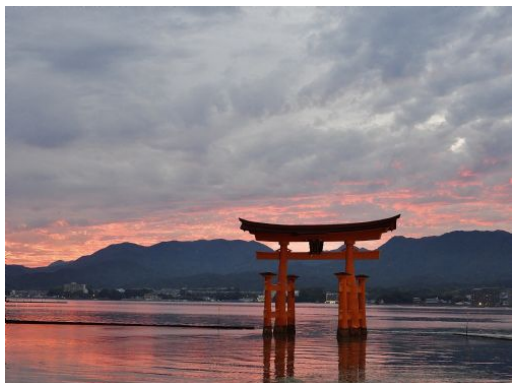
Pedro Collado Foto: Torii de la isla de Miyajima en la bahía de Hiroshima

A las 08:00 am dejaremos preparadas nuestras maletas para que sean trasladadas a Osaka. Debemos prever una pequeña bolsa con lo necesario para 1 día.