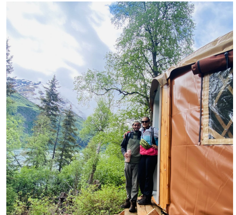
Yurta en Moose Pass

Fairbanks: Bridgewater Hotel o similar. Hotel de 2 estrellas, habitación con baño privado y dos camas queen para compartir con un compañero de viaje del mismo sexo o un acompañante.