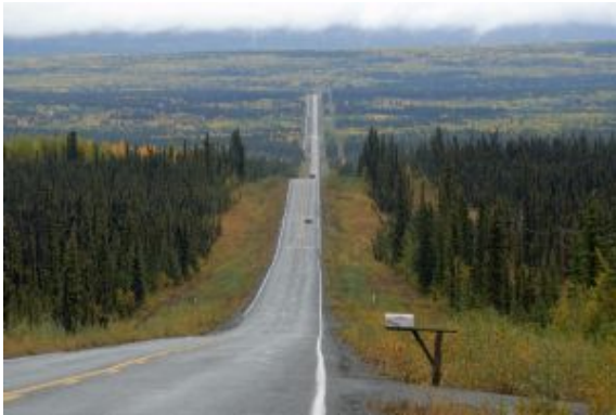
Carretera al horizonte