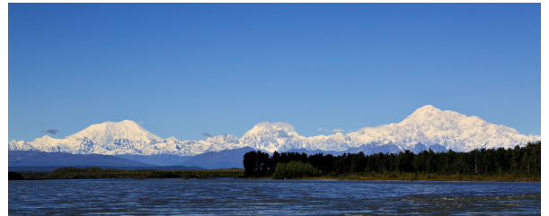
Autor: Mikel Larretxea