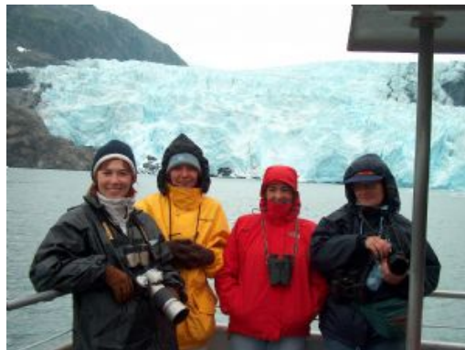
Viajeros Kenai Fjords