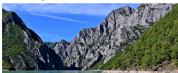
Autor: Luis Alberto Benito