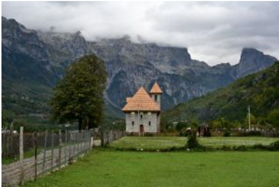
Día 7 - Iglesia Valle de Theth