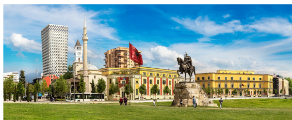
Autor: Archivo Tuareg