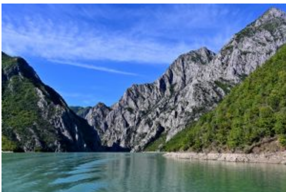
Día 9 - Koman Lago