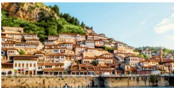
Día 2 - Berat