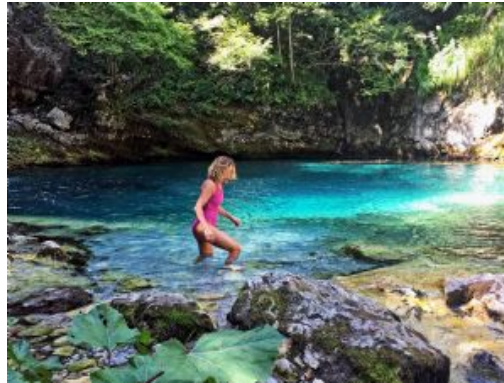
Día 8 - Valle de Theth