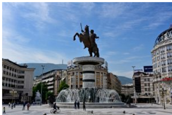
Día 10 - Skopje