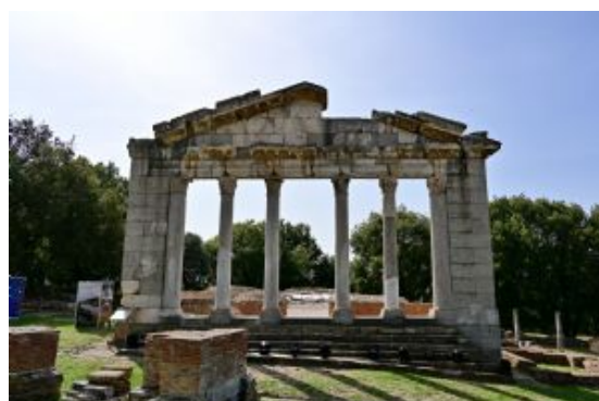
Día 3 - Apollonia