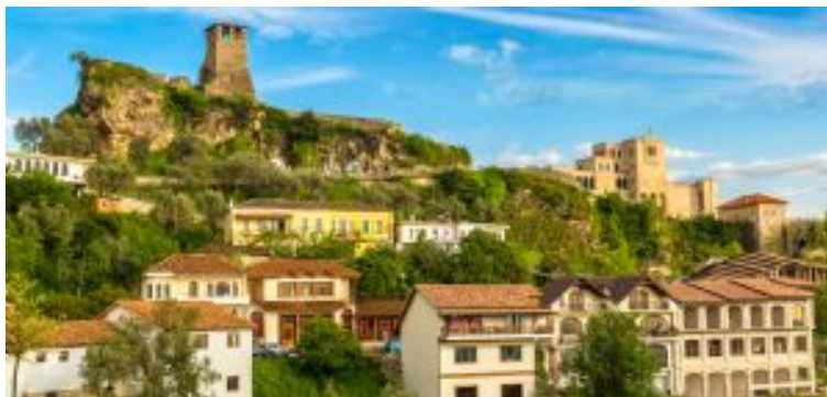
Día 6 - Kruja