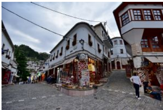
Día 5 - Gjirokastra