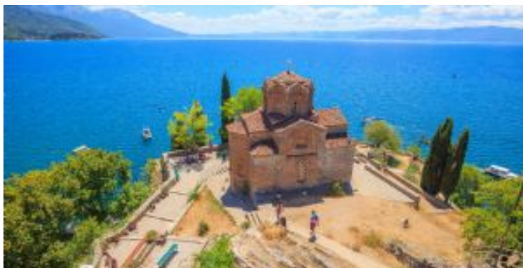
Día 11 - Ohrid