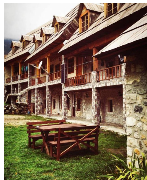
Casa local Theth