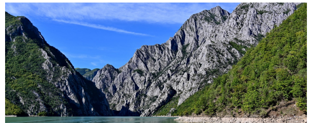
Autor:Luis Alberto Benito