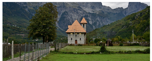
Autor:Luis Alberto Benito