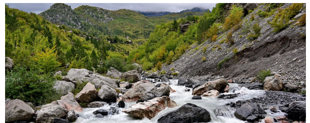
Autor:Luis Alberto Benito