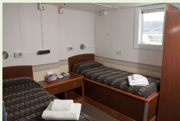
M/V Ushuaia. Cabina doble