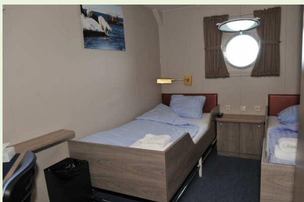
M/V Plancius. Cabina doble