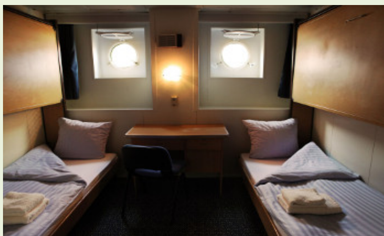
M/V Ortelius. Cabina doble