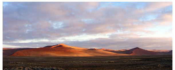
Autor: Carlos ANTON