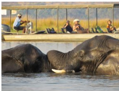
Chobe Safari Cruise