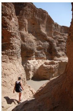
Sesriem Canyon

Distancias/Tiempo de conducción: 40Km > +-45 min.