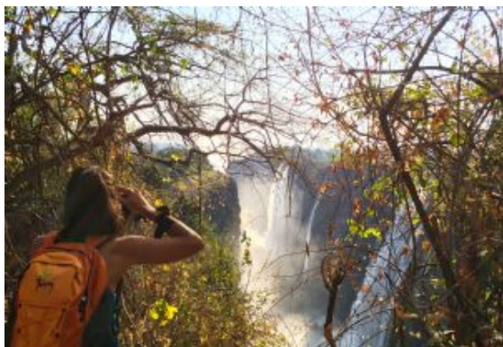
Cataratas Victoria 3