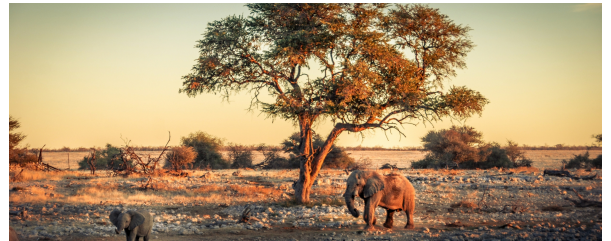
Autor: Archivo Tuareg