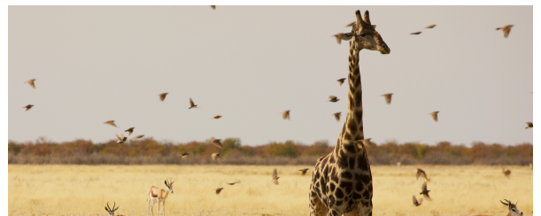
Autor: Enrique Benavides