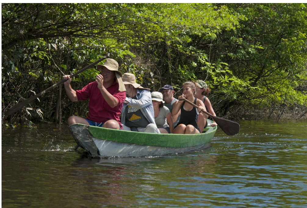
Paseos en canoa

El barco dispone de canoas para efectuar estas excursiones, que también pueden utilizarse para las (excitantes) salidas nocturnas o para desplazamientos cortos