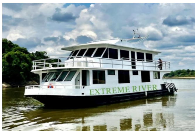
Barco Extreme River

Yate Bosa Nova: 4 camarotes dobles, con baño y A/C