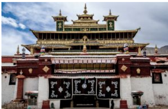
Monasterio de Samye