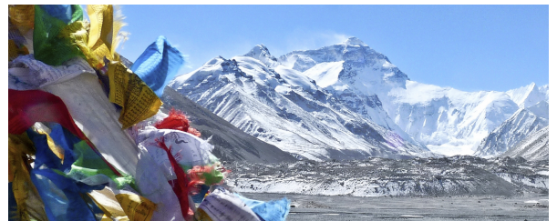
Autor: Josep Paga