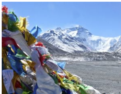
Tibet Camp base Everest