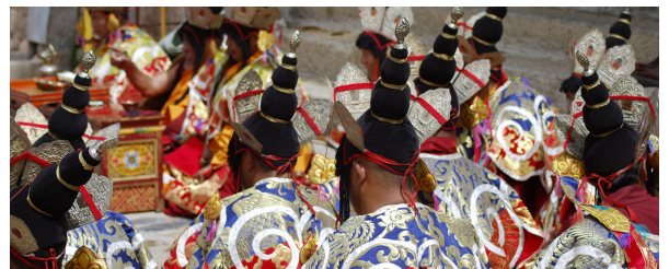
Autor: Marga Poza