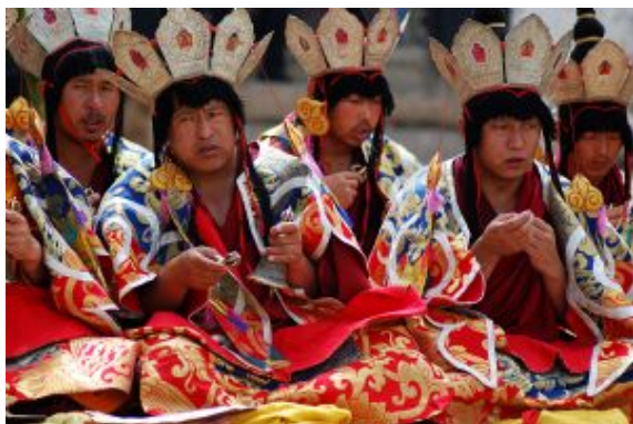
Ritual de reencarnación Monasterio Sera Lhasa Autor: Juan A Vallejo