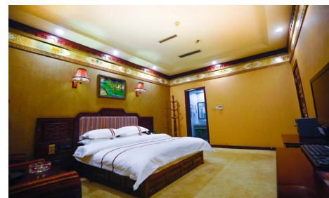
Hotel Shiga Yangcha_Shigatse