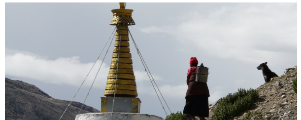
Autor: Montserrat Torra