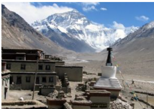
Monasterio de Rongbuk