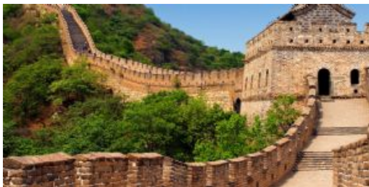
Gran Muralla China

Después del desayuno, saldremos para visitar la Gran Muralla (no incluye teleférico), en un tramo muy auténtico poco restaurado y transitado, la sección de Mutianyu, donde se podrá hacer una caminata de una hora aproximadamente. Finalizada la visita, regresaremos a Pekín, para visitar el famoso Palacio de Verano o Jardín de la Salud y la Armonía, un gigantesco parque que servía a los antiguos emperadores Qing de lugar de veraneo en su búsqueda por un lugar fresco que cumpliera los preceptos del feng shui. En este parque veremos la Colina de la Longevidad Milenaria, con sus palacios y jardines, el inmenso Lago Kunming, con sus puentes y el antiguo Barco de Mármol inmóvil al lado de una de sus orillas, y el Gran Corredor, con sus fantásticos murales con pinturas clásicas chinas de una gran maestría técnica. Al finalizar regreso al hotel.