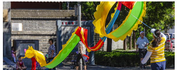
Autor: Alejandro Melian