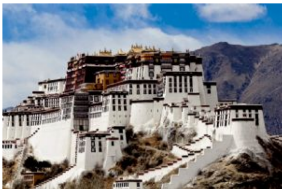
Palacio de Potala

Después del desayuno iniciaremos las visitas de hoy por la ciudad de Lhasa, empezando por el famoso e icónico Palacio de Potala, antigua residencia invernal del Dalai Lama, ubicado en la Montaña Roja a 3.700 metros de altitud. Este palacio nos deslumbrará con sus más de 1.000 habitaciones y sus impresionantes vistas panorámicas de la ciudad. Luego, nos sumergiremos en la espiritualidad del Templo de Jokhang, un centro espiritual clave, construido en el siglo VII, donde podremos admirar la valiosa estatua del Buda Sakyamuni. Para finalizar, daremos un paseo por la animada calle Barkhor, donde conectaremos de lleno con la vida local y las tradiciones tibetanas.