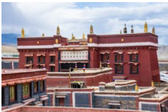
Monasterio de Sakya