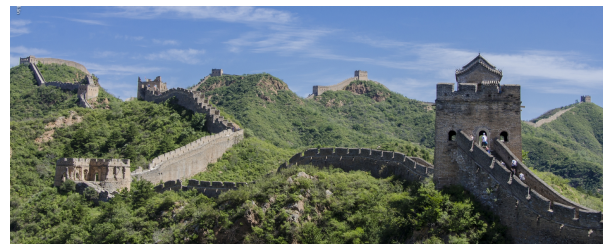
Autor: Alejandro Melian