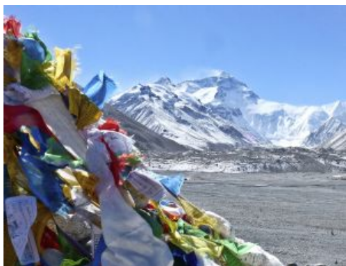
Tibet Camp base Everest