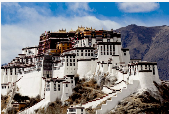
Palacio de Potala

El Palacio de Potala , una joya arquitectónica única en el corazón de Lhasa, fue declarado Patrimonio de la Humanidad en 1994. Este majestuoso complejo de más de 1.000 habitaciones se eleva a 3.700 metros sobre el nivel del mar, ofreciendo una experiencia cultural extraordinaria. Sus imponentes muros blancos y rojos albergan tesoros históricos, murales antiguos, estatuas de Buda y manuscritos que narran siglos de tradición tibetana. Un recorrido de una hora nos permitirá explorar los Palacios donde en cada rincón se respira espiritualidad e historia. El Palacio de Potala no es solo un monumento turístico, es un viaje que eleva el espíritu, combinando arquitectura, cultura budista y paisajes impresionantes.