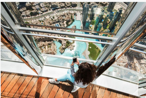
Dubái Burj Khalifa

Consulte precios y disponibilidad para visitas opcionales.