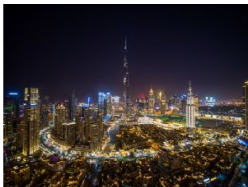
Dubái monumentos 39