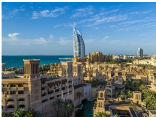
Dubái monumentos 34