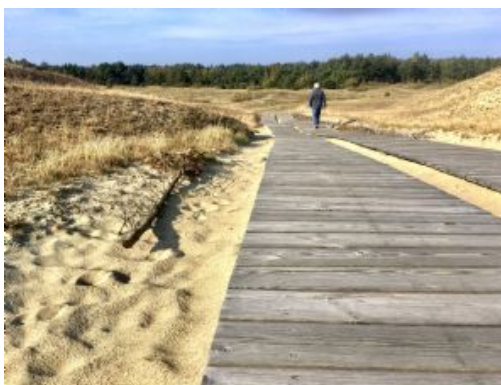
Día 5 - Silvia Marcó