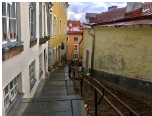
Día 11 - TALLINN