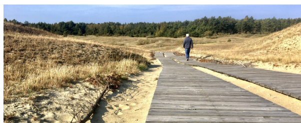
Autor: Silvia Marcó