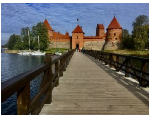
Día 3 - Trakai