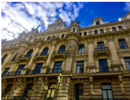
Día 7 - Riga