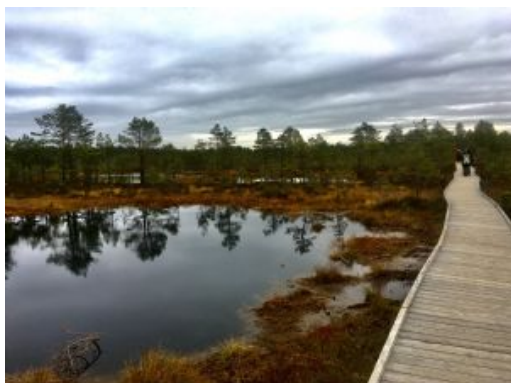
Día 10 - LAHEMAA