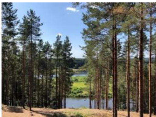
Día 4 - Nemunas River