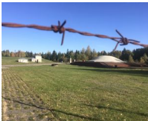
Día 6 - Silvia Marcó