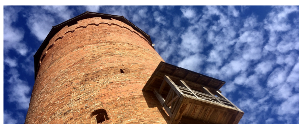
Autor: Silvia Marcó