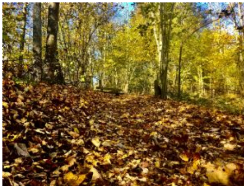
Día 9 - P.N. Gauja