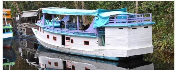
Autor: Mercè Gayà