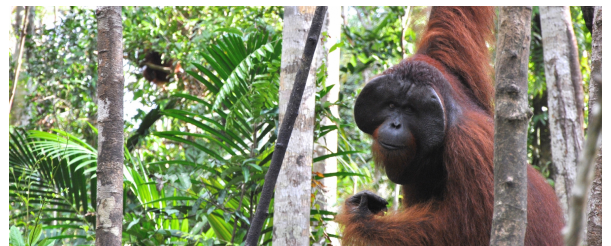
Autor: Mercè Gayà