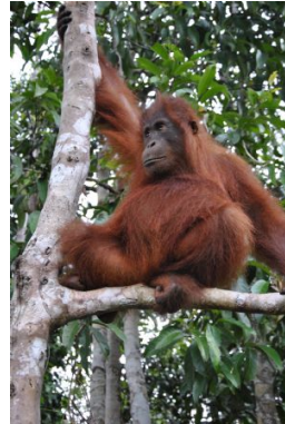
Orangután Autor: Mercè Gaya