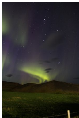
Mývatn Autor:Kepa Garmendia