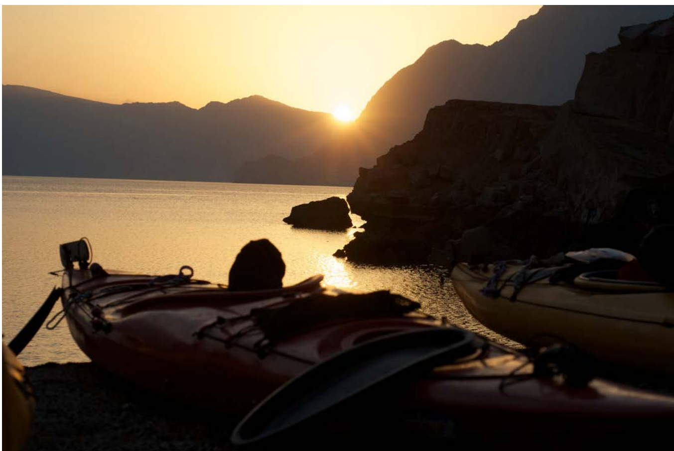
Imagen: David Andreu

Embarque en vuelo de regreso. Llegada a ciudad de origen y fin del viaje.