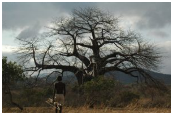
De caza junto al Lago Eyasi

Por la tarde saldremos del cráter y nos dirigiremos a la localidad de Karatu.