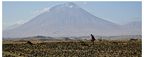
Autor: Aitana Bigorra