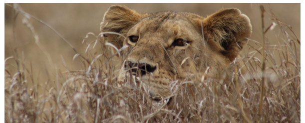
Autor: Begoña Delgado