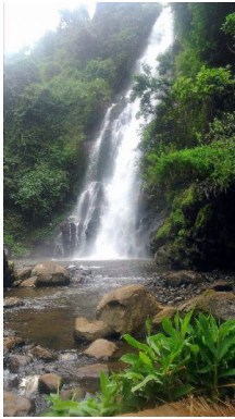
Materuni Falls

Dejamos esta zona y regresaremos a nuestro alojamiento donde pasaremos la noche.