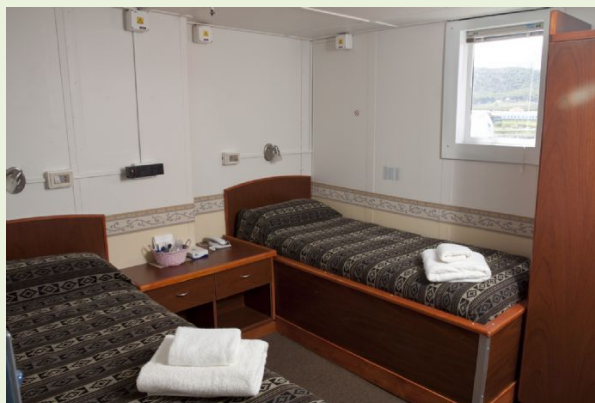
M/V Ushuaia. Cabina doble