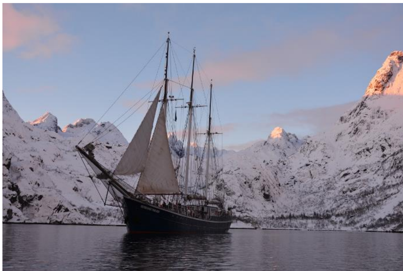
Rembrandt van Rijn.