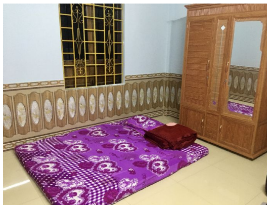
Ngu My Thanh - Homestay

En líneas generales, la acomodación es en hoteles de categoría turista, equivalentes a 3*, en habitaciones dobles. Son establecimientos sin lujos pero limpios y acogedores. Las habitaciones disponen de aire acondicionado, baño privado y mini bar.