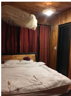
Phong Nha – Homestay